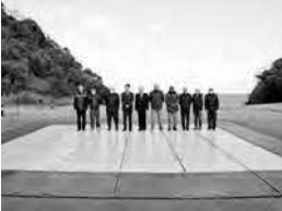
臨時ヘリポート(猪目町地内)

市民の安全・安心を確保するため、防災ハザードマップの更新、分散型防災備蓄倉庫の整備、非常食糧・携帯トイレなどの購入、避難計画の作成推進、原子力防災対策などを行う。