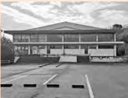
解体予定の旧斐川第 2 体育館

令和 10 年度までに解体予定の 3 つの体育館（旧斐川第 2 体育館、旧出雲体育館、平田体育館）のうち、旧斐川第 2 体育館の解体工事を行う。また、令和 9 年度に解体予定の旧出雲体育館についての実施設計などを行う。