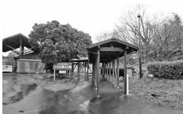
ひかわ美人の湯（斐川町学頭地内）

なお、当該施設は市民のみなさまに欠かせない福利厚生施設であるため、譲渡事業者が決定するまでの間は、市が責任を持って管理運営を行うよう求めました。