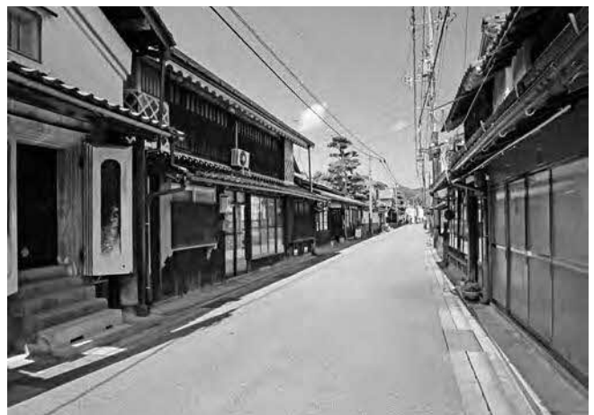
木綿街道の町並み（平田町地内）

れ、歴史的町並みを生かしたまちづくりが継続し、観光拠点として、さらに活性化することを期待しており、地元の皆さまとも連携して準備を進めていきたいと思えます。