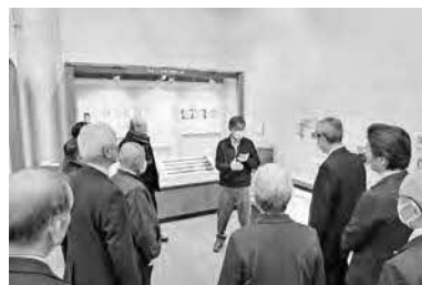
1月19日 島根県東部4市議会議員交流会