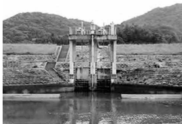
国営事業により整備された斐伊川右岸頭首工（斐川町出西地内）