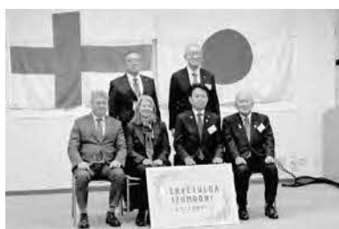
2月1日 フィンランド大使歓迎交流会