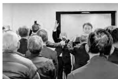
2月9日 トキの放鳥・野生復帰に向けた合同報告会