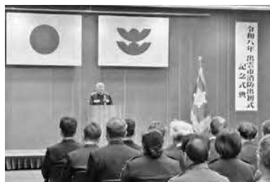
1月11日 出雲市消防出初式