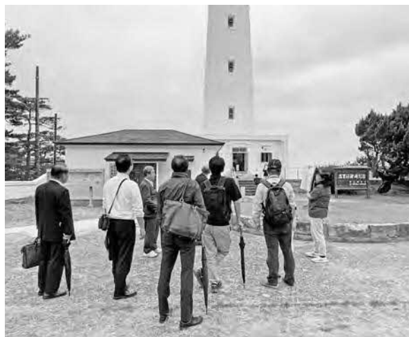
日御碕灯台周辺を視察するようす

がっています。実際に現地を歩くことで、大地のダイナミックな営みを直感的に体感できました。出雲エリアが持つ地質学的価値の高さと、ガイドによるストーリー性のある解説の重要性を再認識しました。今後のジオパーク推進に活かしたいと思います。