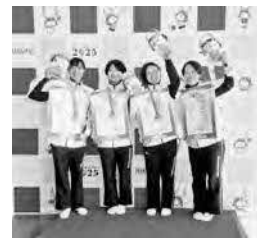
2025年国スポにおける島根県選手団 (なぎなた競技 成年女子の部・優勝)

[出雲市での実施予定競技] 陸上競技、ウェイトリフティング、自転車(トラックレース)など