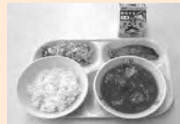
地元産食材を特に多く使用した「おいしい出雲の一日」献立

交付金の活用などにより、令和8年度の小学校の給食費を無償化する。また、中学校、幼稚園については、引き続き保護者負担を軽減する。