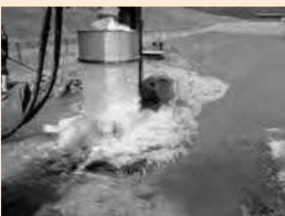
取水井戸の掘削のようす(イメージ)

将来にわたる安定的な取水量の確保を目的に、上島町地内で新たな水源の整備を行う。令和 8 年度から取水井戸の築造に着手する。