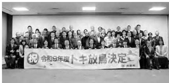
トキの放鳥・野生復帰に向けた合同報告会のようす

協議会としては、これらの思いを汲んでトキの放鳥により市の環境行政や産業振興、地域活性化が進展するよう検討・提案を続けていきたいと考えています。