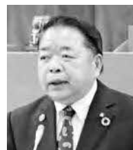
公明党 石橋 広信議員