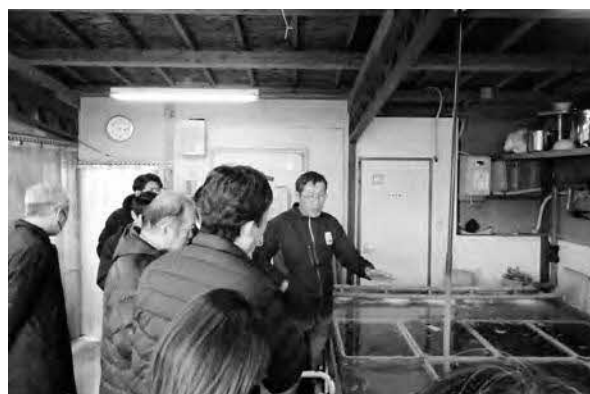
有限会社宍道湖での視察の様子

昨年11月に宍道湖産ヤマトシジミが念願の地理的表示（GI）保護制度に基づく特定農林水産物に登録されたこともあり、今後も議会として、さらなる宍道湖産ヤマトシジミの普及啓発に取り組むとともに、宍道湖の環境整備に努めていきたいと思っております。