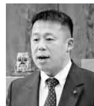
日本共産党 吉井 安見議員