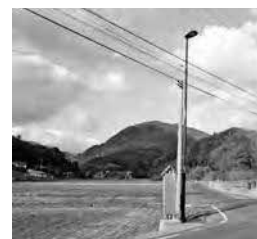
LED照明に更新後の照明灯(多久町地内)

道路照明灯について、消費電力が少なく寿命の長いLED照明灯への交換を促進することにより、電力消費量の節減と維持管理費の軽減を図る。