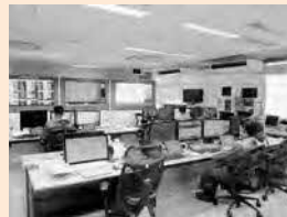
通信指令室のようす

指令管制業務充実強化のための消防緊急通信指令施設機器の更新や消防救急体制の充実強化を図るための高規格救急自動車と小型ポンプ積載車の更新、消防団活動の推進と組織強化のためのコミュニティ消防センターの整備を行う。