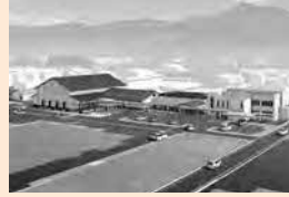
改修後の斐川行政センター (イメージ)

令和 6 年度に庁舎棟を竣工し、引き続き令和 7 年 7 月から多目的棟の建設に着手しており、供用開始は令和 8 年 10 月を予定している。愛称は公募の結果「斐川フラワーホール」に決定。