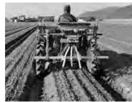
肥料散布のようす

肥料価格高騰対策として、肥料コスト上昇分の一部を支援することを通じて、農業経営への影響を緩和する。 [補助対象者] 農業販売金額が100万円以上である農業者 [補助金額] 2万円～20万円 ※農業販売額による