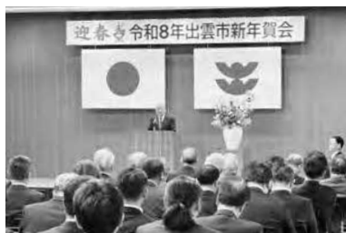
1月5日 令和8年出雲市新年賀会