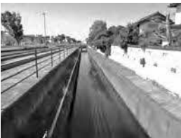
改修予定の水路(小山町地内)

市街地の浸水被害が深刻な地域において、被害軽減に効果的な対策工事の実施や、自助による止水板設置への補助により、浸水被害を軽減し、安全な住環境づくりを推進する。