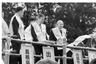
2月3日 須佐大宮節分祭