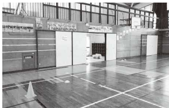
荘原小学校体育館の床の状況