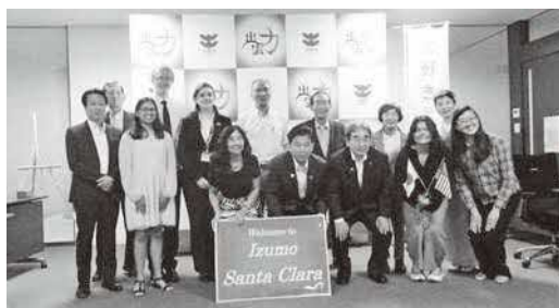
サンタクララ訪問団の皆さんとの交流

6月13日、国際姉妹都市であるサンタクララ市の高校生訪問団が4年ぶりに来雲されました。市内の高校生との交流や市内各所の訪問や体験を通して、楽しい思い出を持ち帰っていただけたのではないかと思います。出雲市とサンタクララ市の交流が今後も末永く続いていくことを願っています。