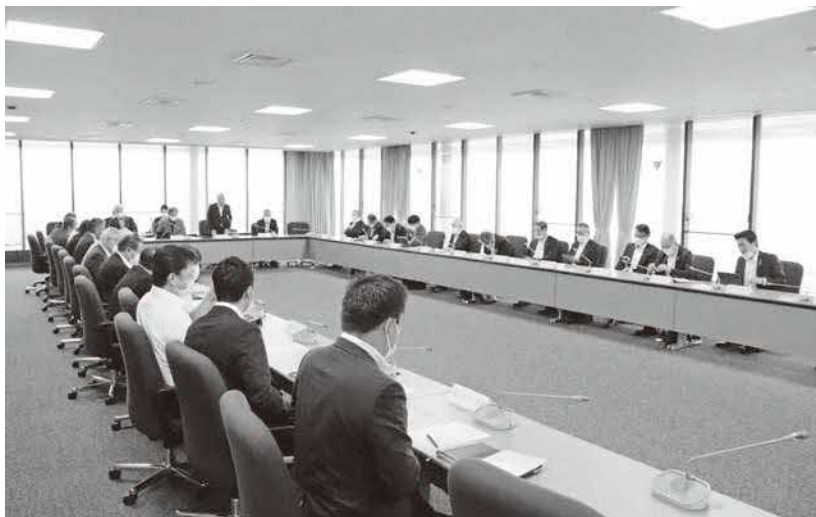
予算特別委員会の様子