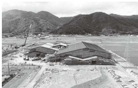
「出雲市総合体育館」建設のようす（西林木町地内）

請願第1号「地方財政の充実・強化に関する意見書の提出を求める請願」については、審査の結果、採択すべきものと決定しました。