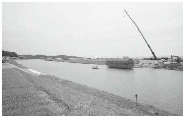
中筋浜線橋梁下部工工事のようす（平田船川）