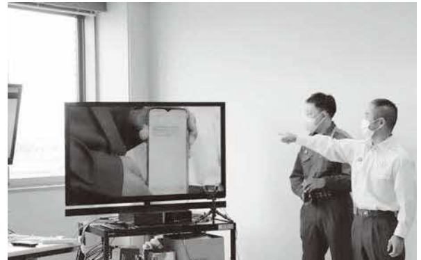
「119番映像通報システム」の説明のようす

今後も各事業が適正に行われているかチェックし、課題の把握に努めていきたいと考えています。