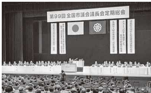
定期総会のようす

6月14日、東京都で開催された全国市議会議長会第99回定期総会に出席しました。役員改選が行われ、空き家・空き地問題に関する特別委員会の委員に選任されました。また、永年勤続議員の表彰があり、出雲市議会からは6名の議員が表彰を受けました。