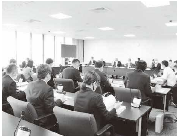
環境経済委員会のようす

ている新工業団地について、令和7年度中の分譲開始を目指し、令和8年1月16日までを工期とする造成工事の工事請負契約を締結するものです。審査の結果、原案のとおり可決すべきものと決定しました。