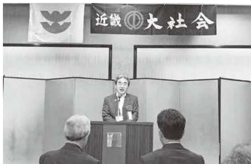
近畿・大社会総会での挨拶

6月25日、大阪府で開催された近畿・大社会総会に出席しました。事業報告のほか、大和すくね相撲甚句や大槌踊りの披露がありました。近畿地方に在住の大社町出身者や大社町に縁のある方々と交流し、出雲の魅力を全国へ発信し、より多くの方々に知っていただきたいという思いを新たにしました。